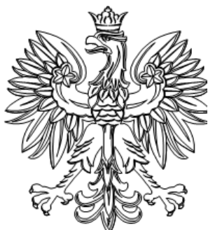
Minister Rozwoju Regionalnego Elżbieta Bieńkowska